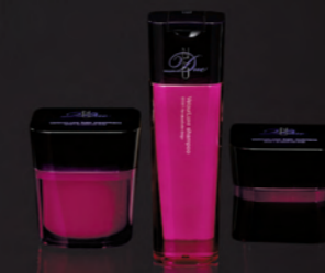
指通りで感じる質感。 ディーセス ノイドゥーエ

美しい髪の実現を創り守るホームケア提案が、 ヘアデザインの一環としてお客さまから求められています。 毛先の先までの美しさにこだわって、サロンクオリティの質感をご自宅でも。 お客さまとヘアデザイナーの間に、ノイドゥーエ。 「いつもキレイでいたい」「いつもキレイを楽しんでほしい」 2つの願いが1つになります。