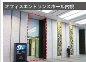
オフィスエントランスホール内観 正面口入って左側の低層階用エレベーターにて3階にお上がりください。