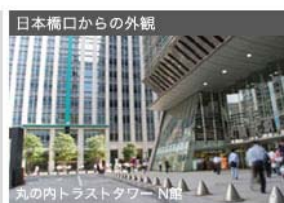
日本橋口からの外観 丸の内トラストタワー N館 東京駅日本橋口から右手に丸の内トラストタワーN館がございます。