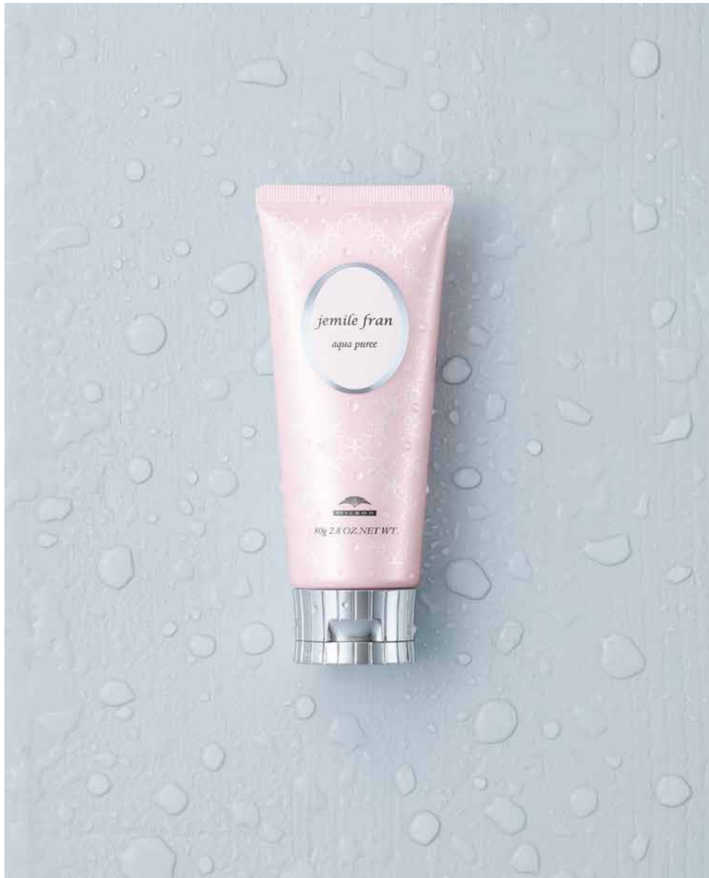
ジェミールフラン アクアピュレ 80g ¥1,600(税抜)

●ミルボン製品は、ヘアデザイナーのアドバイスによりご使用いただく、美容室専売品です。 ●本掲載のヘアスタイル等の写真および、記事・イラスト・ロゴなどの無断転載・複製・改変は、法律により禁じられています。