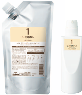
アフターカラー トリートメント 1 600gパック/ 450gボトル(業務専用ポンプ付ボトル)