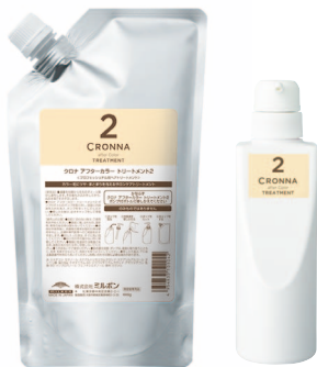
アフターカラー トリートメント 2 600gパック/ 450gボトル(業務専用ポンプ付ボトル)

ダブルのトリートメントにより、成分の高濃度配合が可能になり、ホームケアでは得られない 上質なツヤとなめらかさ、見た目の印象の違いを引き出します。