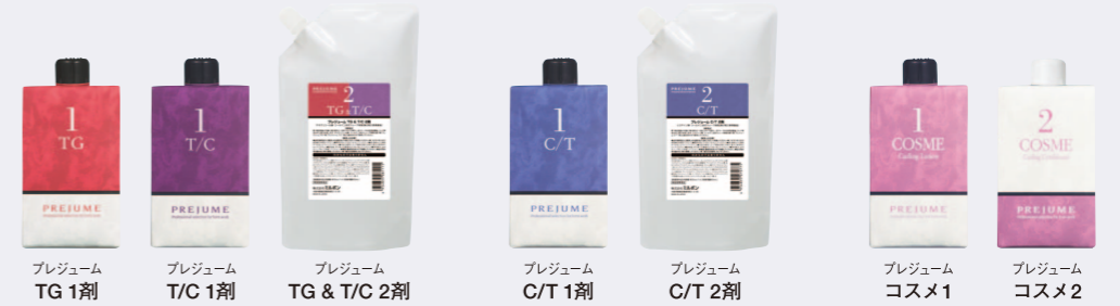
プレジューム TG 1剂 プレジューム T/C 1剂 プレジューム TG & T/C 2剂 プレジューム C/T 1剂 プレジューム C/T 2剂 プレジューム COSME 1 プレジューム COSME 2 チオグリコール酸・コールド二浴式ウェーブ用剤 各第1剂/400mL・第2剂(臭素酸塩)/800mL (医薬部外品) システイン類・コールド二浴式ウェーブ用剤 各第1剂/400mL・第2剂(臭素酸塩)/800mL (医薬部外品) プレジューム COSME1 カーリングローション プレジューム COSME2 カーリングコンディショナー 各400mL (化粧品)

プレジューム パーマセクションは、 繊細なカラーヘアデザインの美しい素材感そのままに、 やわらかくまとまる毛先としなやかなウェーブを表現します。