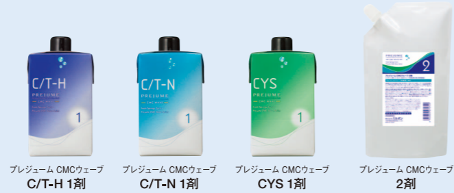
プレジューム CMCウェーブ C/T-H 1剂 プレジューム CMCウェーブ C/T-N 1剂 プレジューム CMCウェーブ CYS 1剂 プレジューム CMCウェーブ 2剂 システイン類・コールド二浴式ウェーブ用剤 各第1剂/400mL・第2剂(臭素酸塩)/800mL (医薬部外品)

プレジューム CMCウェーブは、 やわらかなウェーブ表現が魅力のシス系の特性を高めて、 うるおい感のあるプルンとしたウェーブ感を創ります。