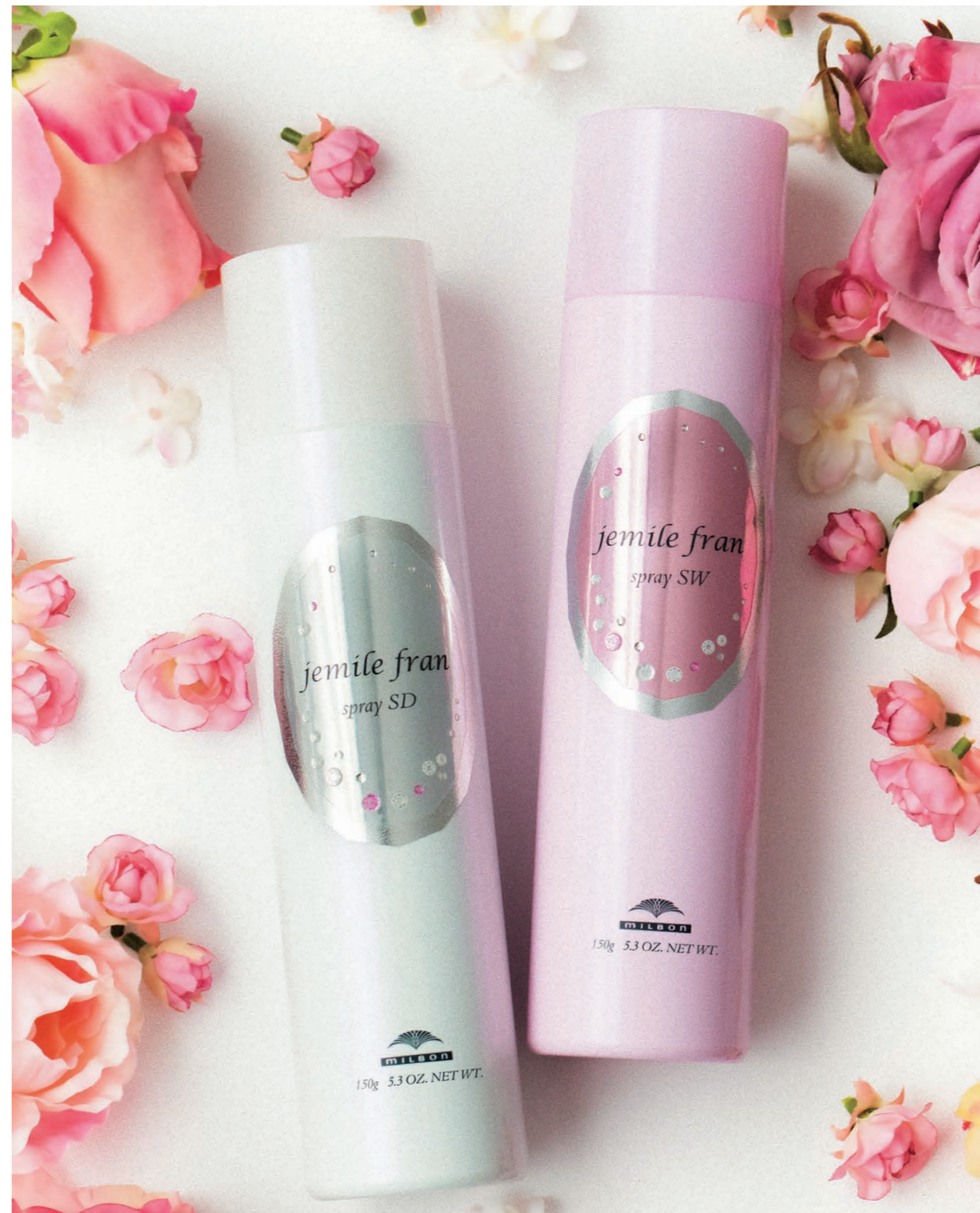
ジェミールフラン スプレー SD 150g ¥1,600 (税抜) ジェミールフラン スプレー SW 150g ¥1,600 (税抜)

●ミルボン製品は、ヘアデザイナーのアドバイスによりご使用いただく、美容室専売品です。 ●本掲載のヘアスタイル等の写真および、記事・イラスト・ロゴなどの無断転載・複製・改変は、法律により禁じられています。 株式会社 ミルボン 本社 大阪府都島区善源寺町2-3-36 〒534-0015 TEL06-6828-2331 http://www.milbon.co.jp □東京青山店 東京都渋谷区神宮前2-6-9 〒150-0001 TEL03-3470-9547 □大阪支店 大阪府西区京町堀1-9-8 〒550-0003 TEL06-6443-6116 □仙台営業所 仙台市青葉区中央2-8-13 〒980-0021 TEL022-722-2411 □金沢営業所 金沢市駿月4-1-33 〒920-8203 TEL076-268-6777 □広島営業所 広島市中区袋町3-1-7 〒730-0036 TEL082-247-4571 □東京銀座支店 東京都中央区銀座3-9-7 〒104-0061 TEL03-3624-2350 □福岡支店 福岡市中央区天神1-3-38 〒810-0001 TEL092-782-1120 □さいたま営業所 さいたま市大宮区宮町1-114-1 〒330-0802 TEL048-650-5821 □京都営業所 京都市下京区立売東町1-2-1 〒600-8005 TEL075-253-6641 □名古屋支店 名古屋市中区栄3-19-8 〒460-0008 TEL052-243-5040 □札幌営業所 札幌市中央区大通西3-4 〒060-0042 TEL011-272-3801 □横浜営業所 横浜市西区南幸2-20-5 〒220-0005 TEL045-317-0877 □神戸営業所 神戸市中央区三宮町2-7-4 〒650-0021 TEL078-391-0780