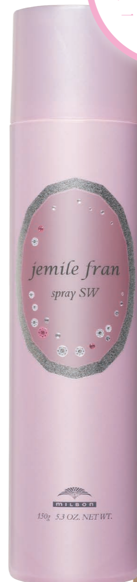
ジェミールフラン スプレー SW 150g ¥1,600 (税抜)