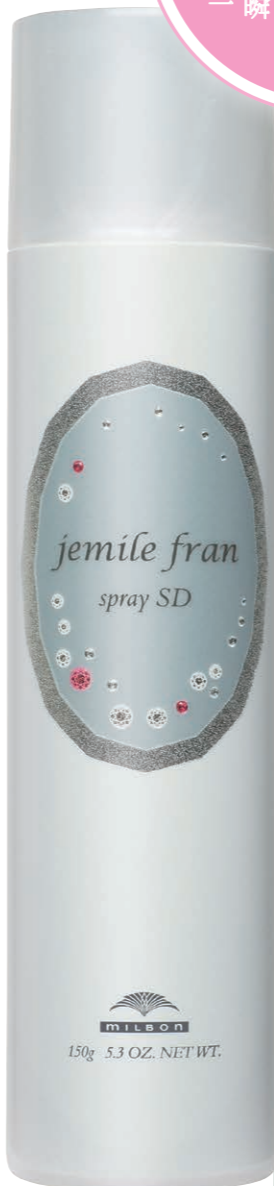
ジェミールフラン スプレー SD 150g ¥1,600 (税抜)

ヘアメイクもナチュラル志向がブームだけど、 やっぱり華やかにメイクアップしたいのが女の子の本心。 もっとキレイに、もっと大人にクールにしたい！