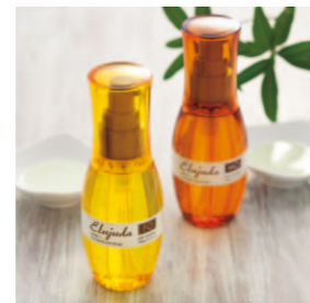
やわらかで動かしやすい髪へ エルジュダ FO 120mL エルジュダ MO 120mL 〈ヘアトリートメント〉各2,600円(税抜)