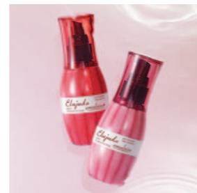
内から潤ったやわふわな髪へ エルジュダ エマルジョン 120g エルジュダ エマルジョン+ 120g 〈ヘアトリートメント〉各2,600円(税抜)