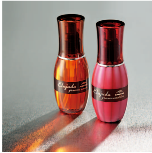
毛先が自然と内に入るやわらかな髪へ エルジュダ グレイソン セラム 120mL エルジュダ グレイソン エマルジョン 120g 〈ヘアトリートメント〉各2,800円(税抜)

サロン仕上げの心地よさを、どんな時も。 女性のライフシーンに寄り添う「エルジュダ」。