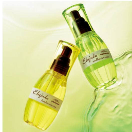
根元からしなやかで動きやすい髪へ エルジュダ リンバーセラム 120mL エルジュダ メロウセラム 120mL 〈ヘアトリートメント〉各2,800円(税抜)