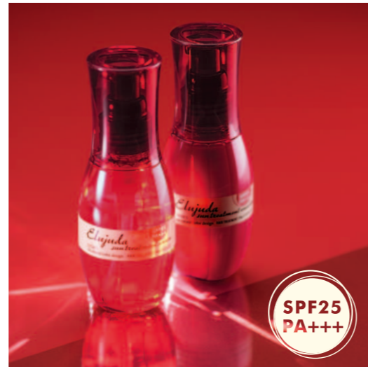
ダメージケア&紫外線カット、潤いのある髪へ エルジュダ サントリートメント セラム 120mL エルジュダ サントリートメント エマルジョン 120g 〈ヘアトリートメント・頭皮用日やけ止め〉各2,800円(税抜)